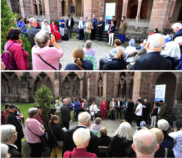
FIG : TEMPS INTER-RELIGIEUX POUR LA PAIX